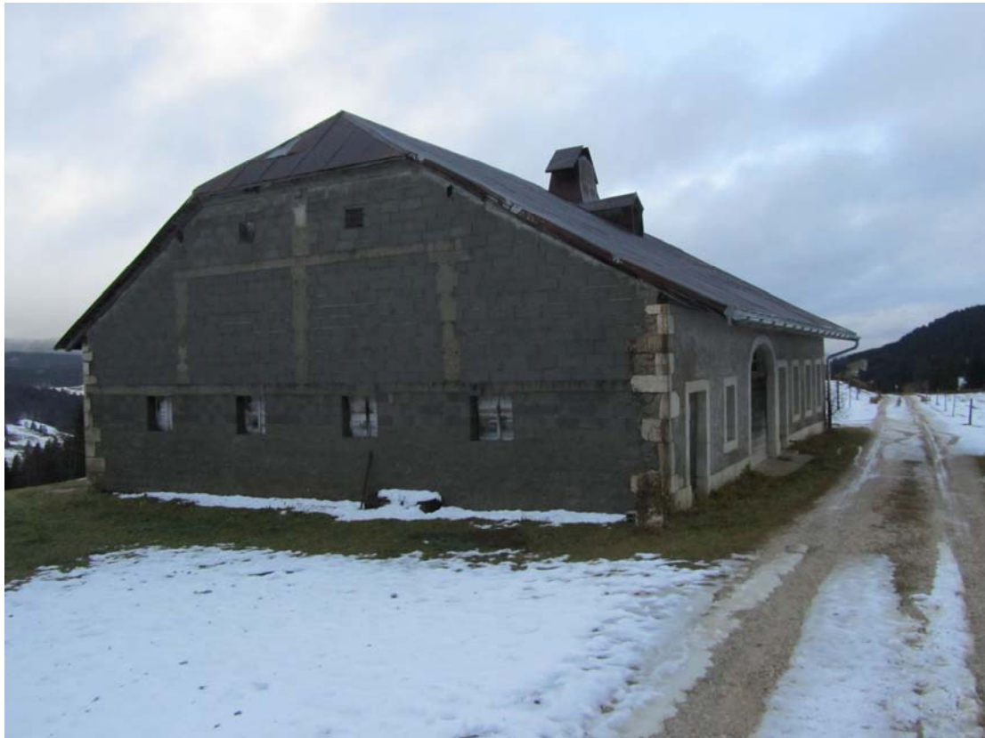
La tristounette façade à vent qui devrait recevoir une chape de tavillons. Ci-dessous petite construction annexe qui devait accueillir autrefois la fontaine traditionnelle.