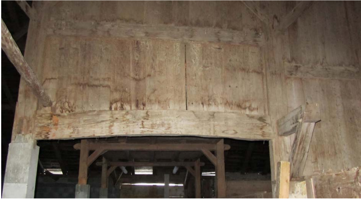
Derrière la porte de grange se cache l'ancien néveau, preuve de transformations ultérieures à la construction, où même à la reconstruction.