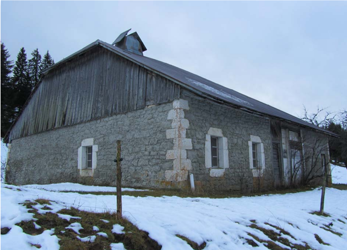
L'arrière de la maison avec la seconde porte de sortie du corridor qui traverse toute la maison.